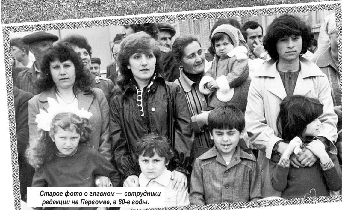
Старое фото о главном — сотрудники редакции на Первомае, в 80-е годы.